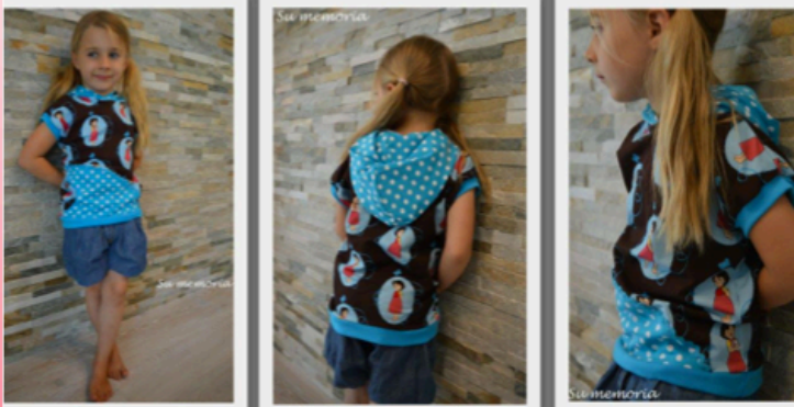
Shirty 2. Teil by Ba-Samba